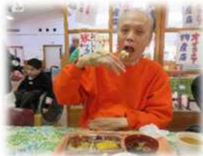
ひつまぶし、大人気。 鰻は絶品ですね♡

ご当地物産展フェアをテーマに久しぶりのレストランを行いました♪「どれにしよう」と、とても悩みながらメニューを選ぶご利用者も居られました😊