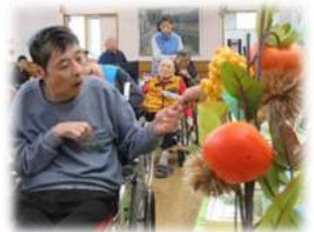
メニュー選びは真剣です