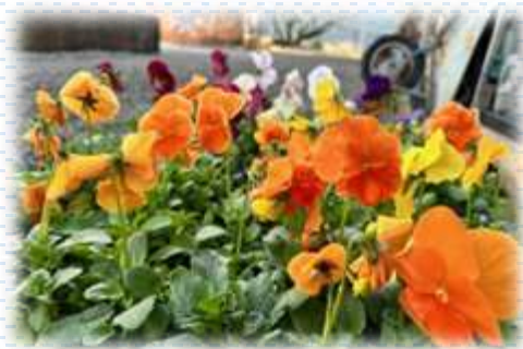
仁井田クラブさんよりお花を頂きました