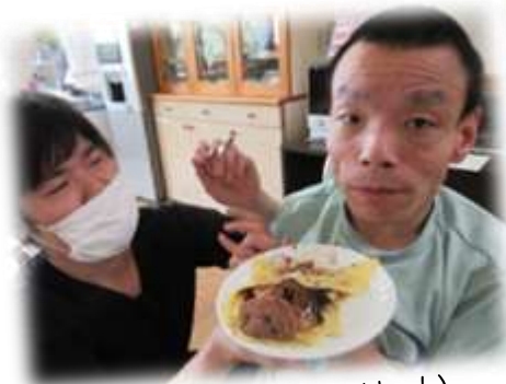
アイスたっぷり、甘〜い