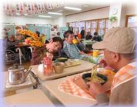
久しぶりのレストランに 皆さん楽しんでいました♪