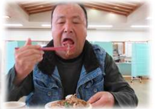
黙々と食べられています🐼