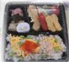
春のちらし寿司弁当