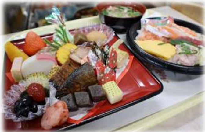
豪華な料理に皆さん大満足♪