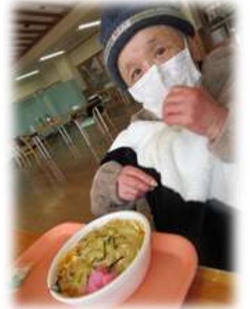
早く食べたくて マスクを忘れていました_(^)_