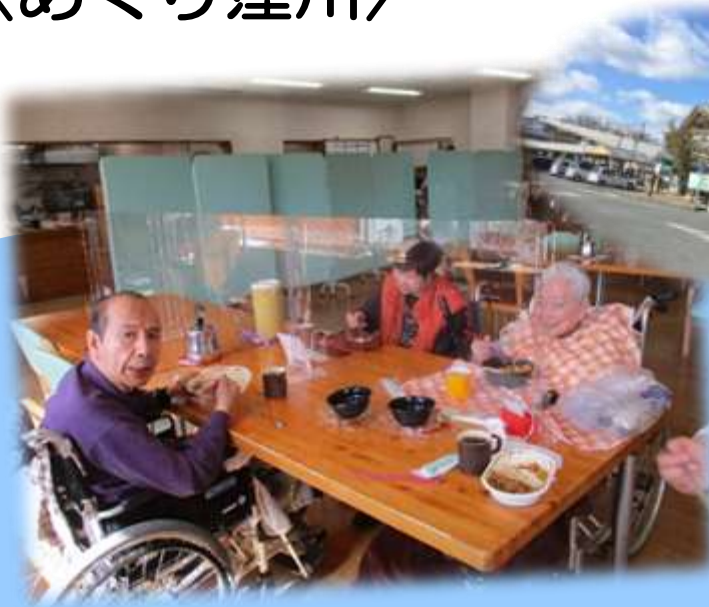
皆さん好きなものを注文され食べられました♪