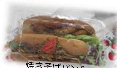
焼きそばパン & コロッケパン