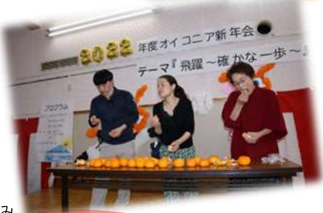
職員による出し物は みかんの早食い コップタワー トイレットペーパー積み