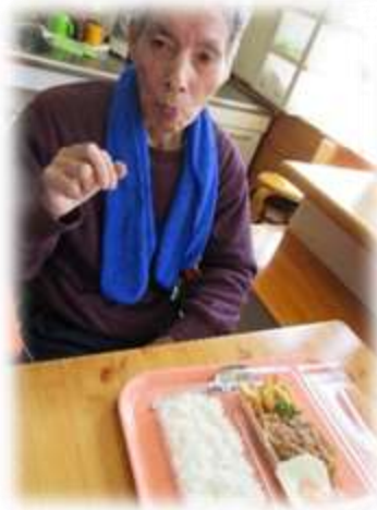
食べる前に記念撮影📷