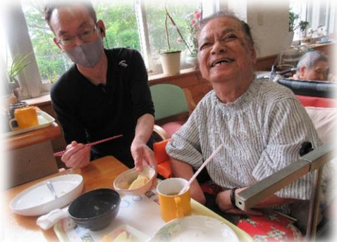
ニコニコ笑顔がいっぱいです(^O^)