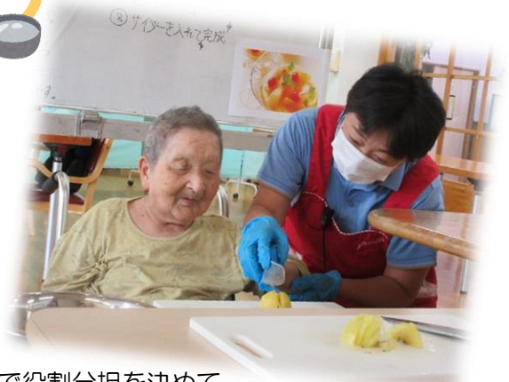
皆で役割分担を決めて 行いました😊