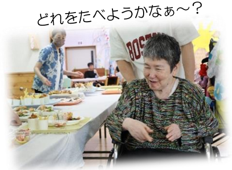
どれをたべようかなあ〜？