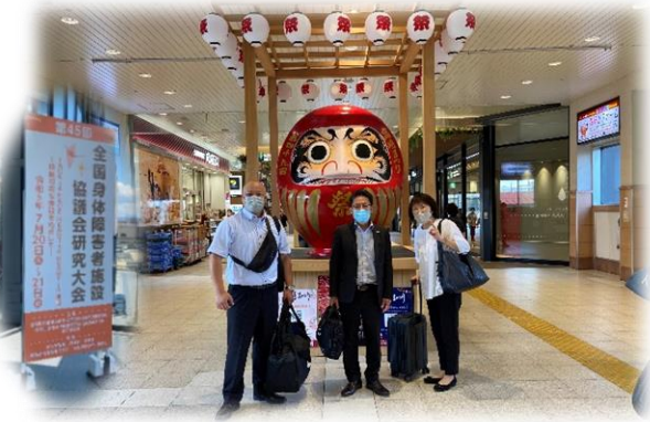
今年は群馬県で開催されました