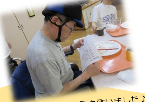
伴奏に合わせて歌も歌いました♪