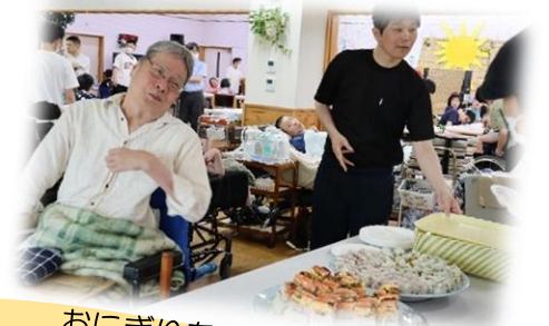
おにぎりを1つおねが〜い！