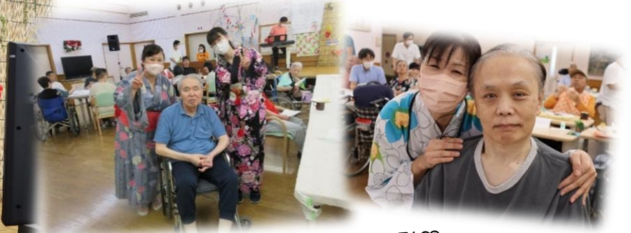
浴衣美人と記念撮影♡