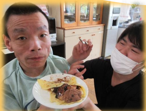
甘い物は美味しい〜