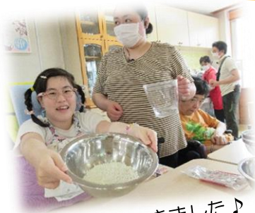
生地ができました♪